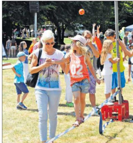
Das Spielfest am Eisweiher gehört zu den Höhepunkten des Jahres 2019. Es findet am 16. Juni statt.